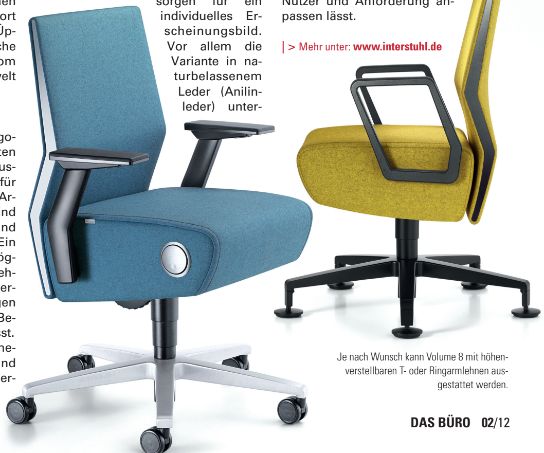
Je nach Wunsch kann Volume 8 mit höhenverstellbaren T- oder Ringarmlehnen ausgestattet werden.