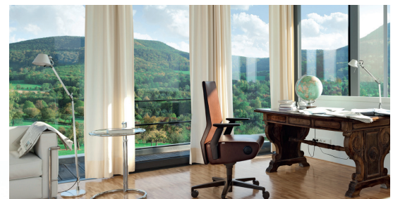
Der Volume 8 trägt als Symbiose aus Wohnen und Arbeiten der zunehmenden Vermischung beider Welten Rechnung.

streicht die Wertigkeit des Designs, wobei die Kontrastnähte das Gesamtbild ausdrucksstark aufwerten. Interstuhl geht mit Volume 8 völlig neue Wege – und zwar weg von der „Sitzmaschine“ im Büro hin zu einem modernen Möbel, das in jede Umgebung passt, sich aber auch je nach Nutzer und Anforderung anpassen lässt.